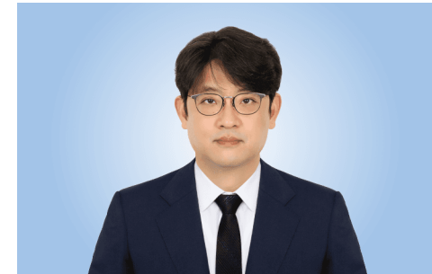
คู ชา มิน