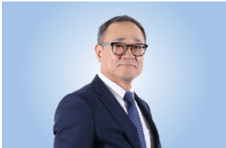
สง โฮ โค